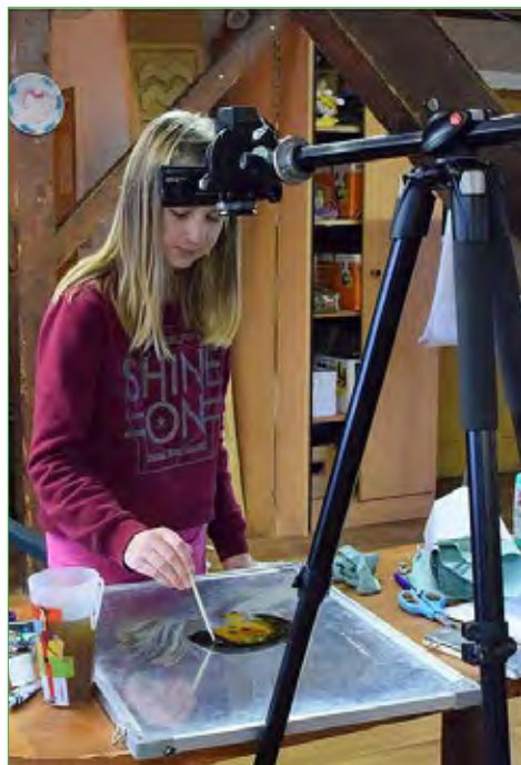
Snímek z kurzu...

Kurz proběhl v klubu Bouda v Českém Krumlově, a to ve dvou termínech – od pátku 9. do neděle 11. listopadu 2018 a pak o týden později, od pátku 16. do neděle 18. listopadu 2018.