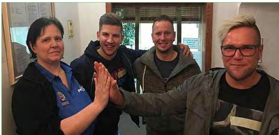
„High-five“ s českokrumlovskou policistkou.