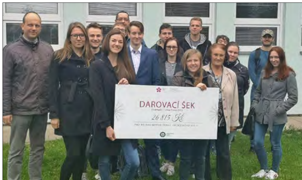
POTRAVINOVA BANKA - Ekonomická Fakulta Jihočeské univerzity, kteří pro jihočeskou potravinovou banku vynikající kávou vyvařili 26.815 korun. -fb-